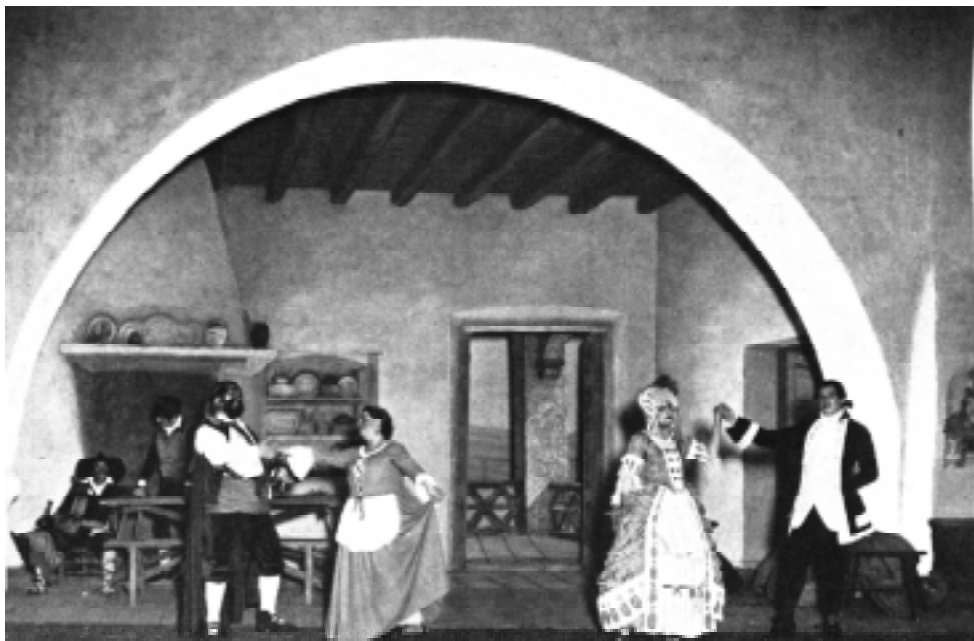
Darrera escena d' El Giravolt de maig

Tot s'esdevé en el transcurs d'una màgica nit primaveral del mes de maig, en el redós d'un modest hostel d'un petit poble de muntanya en el segle XVIII, escenari ideal per a contes d'aventures i misteris... La música ambienta la qualitat pertorbadora de l'encís sensual de la nit de primavera en la qual es descabdella l'acció. El so llunyà d'unes campanes s'esvaeix, envoltat per les primeres fosques nocturnes. S'acosta, i poc a poc desapareix, la cançó d'un pastor que passa amb el remat: " Mes de maig, mes de maig, bella és la rosa i verd el faig. No se sap què tothom espera; el mes de maig tot s'adelerà i el desig us sobta un raig. Mes de maig, mes de maig... ". L'encant melangiós de la cançó s'esvaeix i ve una mena de silenci vívid, marcat per els afanys misteriosos de la naturalesa.