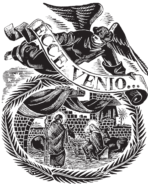
Gravat de Ricart corresponent a la Nadala de l'any 1989

La muntanya de Montserrat amb el tinter i la ploma (gravat diferent de l'anterior) també correspon al llibre "Montserrat, llegendes i tradicions" de Joan Amades 6 .